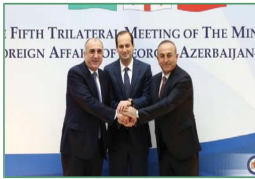
FIFTH TRILATERAL MEETING OF THE MINISTERS OF FOREIGN AFFAIRS OF GEORGIA, AZERBAIJAN AND TURKEY

BTK dəmir yolu Gürcüstan-Azərbaycan-Türkiyə hökumətlərarası sazişi əsasında inşa olunur. Onun istismara verilməsi cari ilin ikinci yarısına planlaşdırılıb.